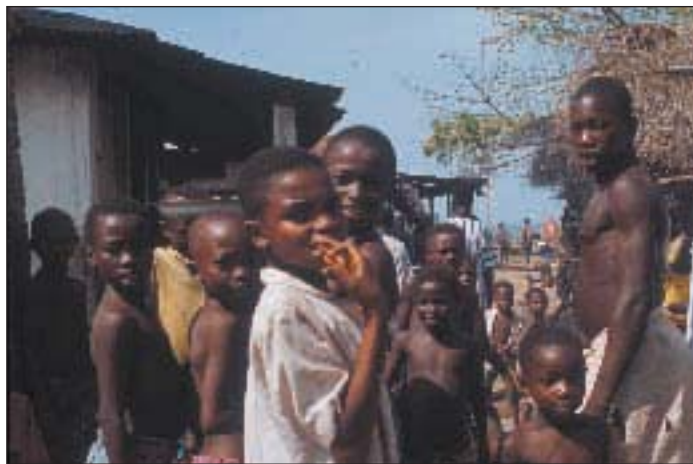
Ci-dessus: Le paludisme obère les ressources communautaires et personnelles et piège les familles dans un cercle impitoyable de pauvreté. Ci-dessous: Il est impossible d'évaluer le coût du paludisme en termes de souffrances humaines.

Conscients du fardeau que cela représente pour leurs économies, les gouvernements d'Afrique consacrent désormais davantage de ressources à la lutte antipaludique, conformément aux résolutions du Sommet d'Abuja en 2000. Le paludisme prend aussi une place importante dans les discussions sur la réduction de la pauvreté et l'allègement de la dette, et la lutte antipaludique apparaît maintenant aux yeux de nombreuses personnes comme un élément majeur des stratégies nationales de réduction de la pauvreté dans les pays d'endémie palustre. Les pays prennent également des mesures pour assurer l'opportunité des dépenses directes consacrées au paludisme et faire en sorte que les moustiquaires imprégnées d'insecticide servant à la prévention du paludisme deviennent plus accessibles en abolissant les taxes et les droits de douane sur les insecticides, les moustiquaires et les matériaux utilisés pour les fabriquer.